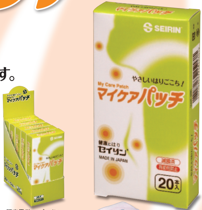
販売用ディスプレイになります。