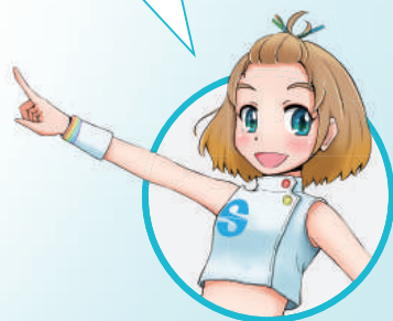
公式キャラクター りんちゃん

本体仕様【定格電源】①本体：DC3.7V(リチウムイオン充電電池)、DC5.9V(ACアダプタ) ②ACアダプタ：AC100V 50/60Hz【定格消費電力】12VA【出力電流】最大1mA以下(実効値)【出力電圧】最大10V±20%(ピーク値、500Ω負荷)【出力周波数】最大100Hz【タイマー】30分±5%【電撃に対する保護の形式と程度】クラスII及び内部電源機器、BF形【サイズ】(H)140×(W)69.4×(D)21.8mm【重量】160g(リチウムイオン充電電池含む)